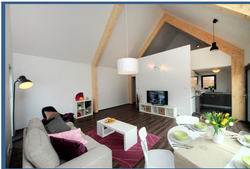
Interiér inteligentního domu