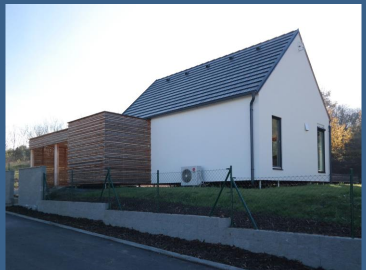
Ukázkový inteligentní dům

Adresa: Nad Běloky 386 Středokluky PŠČ 252 68